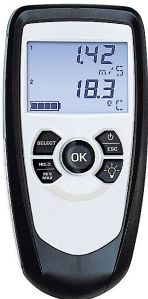
LVA - Hélice Ø 100 mm - non débrochable